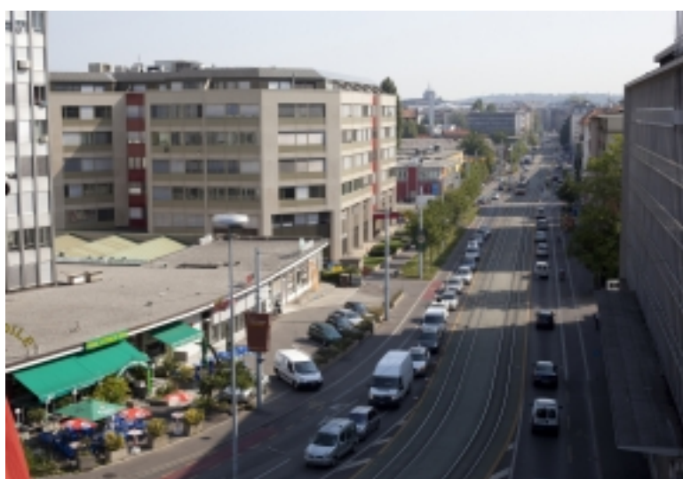
Le quartier de la Praille. La coopérative a comme objectif d'intégrer de la culture et des acteurs culturels dans les quartier en développement. JEAN-PATRICK DI SILVESTRO

Depuis le mois de mai, Ressources urbaines dispose d'un premier bâtiment de 170 m 2 situé au 76, route des Acacias. L'Etat en est propriétaire, mais le collectif a signé un bail de trois ans avec l'Office des bâtiments (OBA) pour l'ensemble des locaux du rez-de-chaussée. Dès le mois de juin, Ressources urbaines y expérimentera un projet de «Commun». Pour ce faire, l'immeuble sera aménagé en espaces de travail collectifs. L'attribution d'ateliers sera réservée aux membres